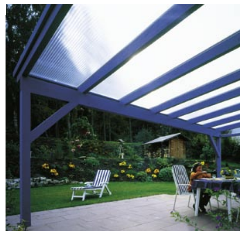
Kenn-Nr. 434-4 Februar 2007